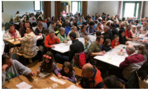
photo de classe dont les bénéfices reviennent à l'association.

Parmi les actions organisées, nous pouvons citer le marché de Noël avec une tombola où plusieurs exposants ont répondu présents, le quine au mois d'avril qui a, comme chaque fois, rencontré un franc succès ou encore la